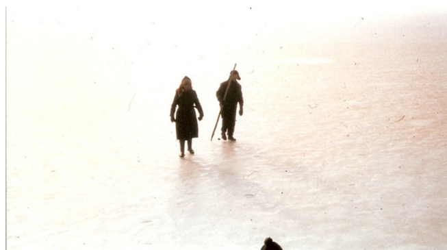
Greve følger en passager over isen fra Hjortø til Ærøfærgen i sejlrenden. 1982 Når havet lukker helt til bliver Hjortø afskåret. Færdsel til og fra øen foregår på gåben – eller med den gamle Nimbus.