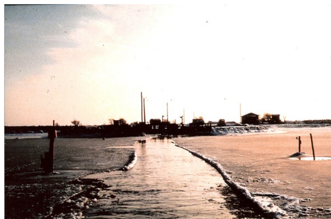
Isvinteren 1982. Sejlrenden til Hjortø havn holdes lige akkurat isfri.