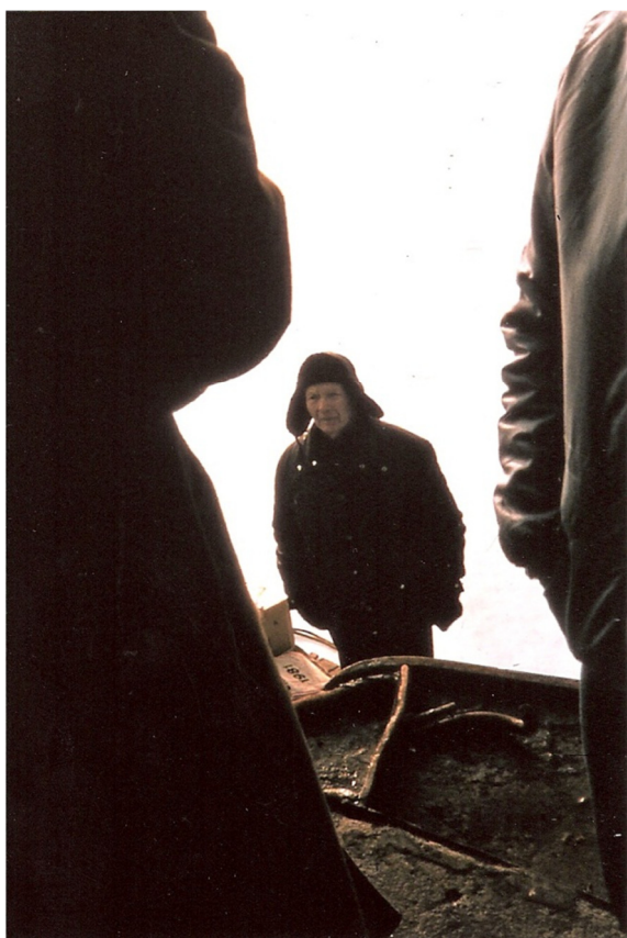
Greve henter/afleverer post i sejlrenden ved Ærøfærgen. Isvinteren 1982