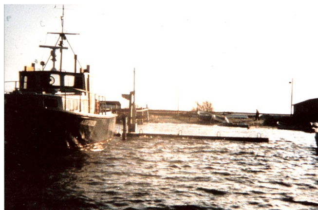
Hjortø havn ved højvande i 1982 En anden af vejrets ekstreme situationer.